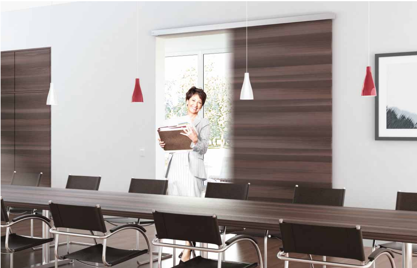
Schiebetür-Automatik CS 80 MAGNEO – hier an dem Holztürlügel eines Konferenzraums verbaut.

„Wenn wir alle Hände voll zu tun haben, sind Automatiktüren eine große Erleichterung.“