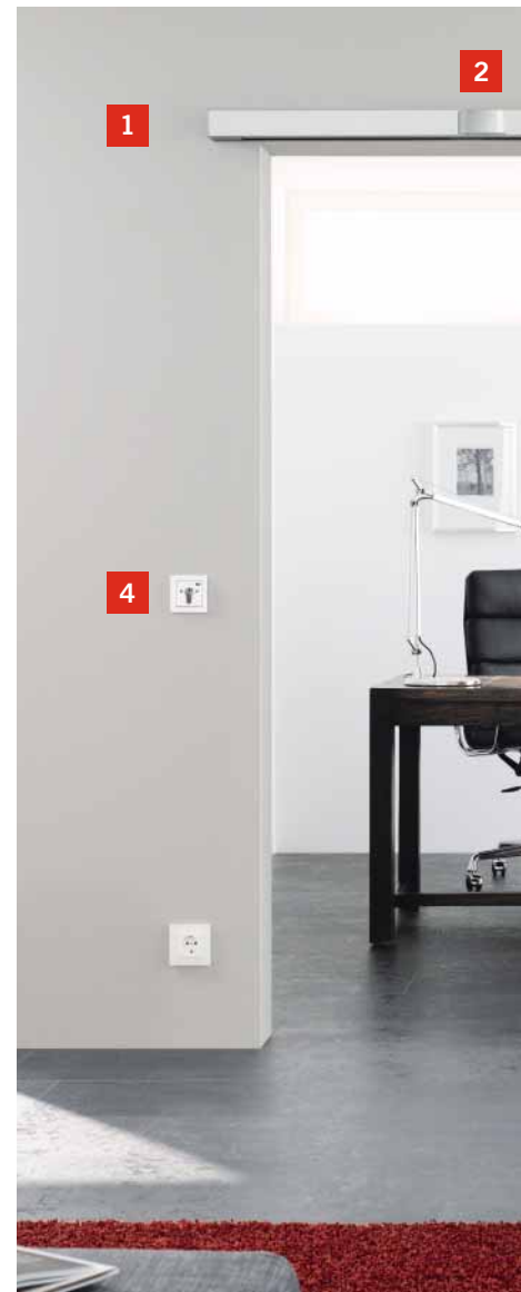
Oberfläche DORMA Design Niro matt. Der CS 80 MAGNEO mit DORMA Design Niro matt Oberfläche – passend zur Edelstahl-Optik des AGILE (Bild unten).

Der automatische Schiebetürantrieb CS 80 MAGNEO bietet jetzt neben der bekannten Aluminium-Oberfläche auch eine Oberfläche in Edelstahl-Optik: DORMA Design Niro matt. Das klare Design harmoniert mit der Edelstahl-Optik des manuellen Schiebetürantriebs AGILE und betont das hochwertige und moderne Gesamtkonzept der Inneneinrichtung. Ebenfalls mit Design Niro matt verfügbar sind die MANET Glashalterungen und die Griffmuschel. Die neue Verriegelungsfunktion schützt Räume vor dem Zutritt durch Unbefugte. Sie ist von außen unsichtbar unter der Abdeckung installiert. Ein Schlüsseltaster steuert die Ver- und Entriegelung.